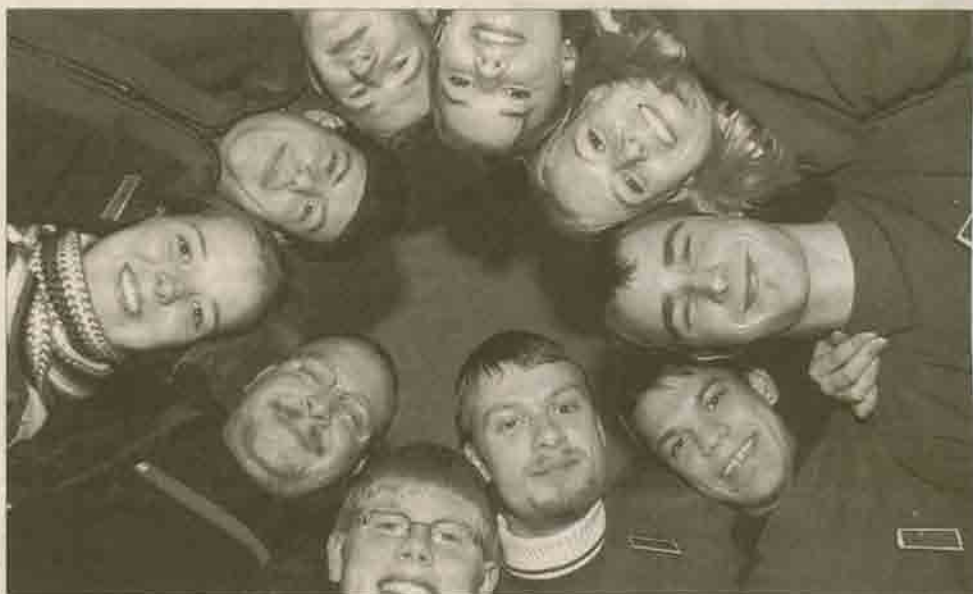
Die Jungfilmer der Jugendfeuerwehr Leitershofen stellen ihren Film „Brandheiß“ beim Schwäbischen Jugendfilmfest vor.

Der Film habe beim Feuerwehr-Jubiläum so überzeugt, erzählt die junge Truppe, dass man sich spontan entschlossen habe, ihn bei der „offiziellen Abendveranstaltung“ zu zeigen. Die Feuerwehrleute können nicht lange beim Filmfest bleiben. Schon ziehen sie wieder ab. Ihr nächster Einsatz heißt: Geräte winterfest